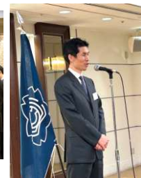
光畑人材育成課長 締めめの挨拶