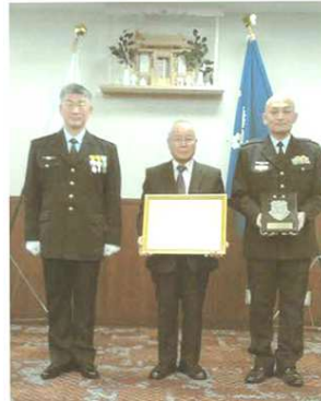
← 西部航空管制団 司令から 感謝状を受賞 (山口県家族会萩支部)