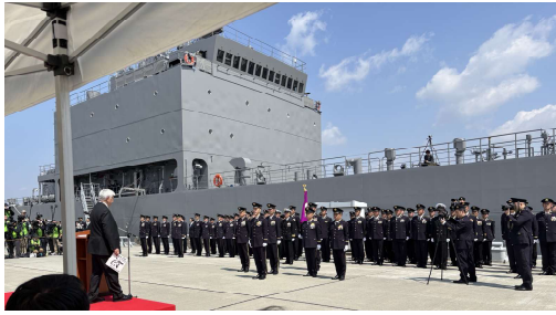
自衛隊海上輸送群の編成完結式に参加 (広島県家族会)