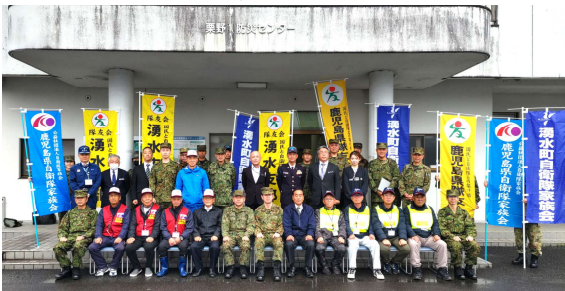
国分駐屯地業務隊が計画する家族支援安否確認検証訓練参加 (湧水町自衛家族会)