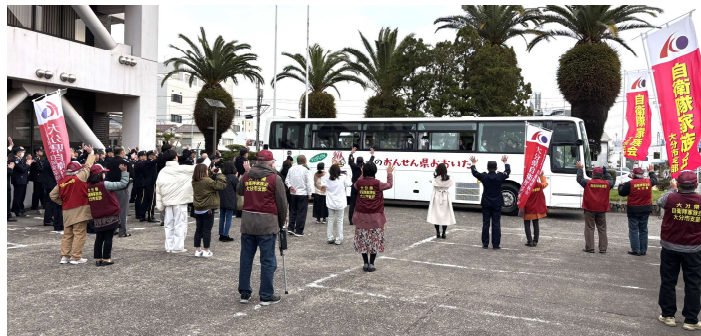
大分地方協力本部の実施する 国分駐屯地への新入隊者（19名）の見送り行事に参加