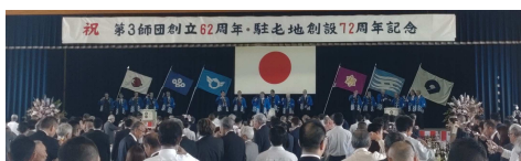
千僧駐屯地、第3師団 祝賀会食